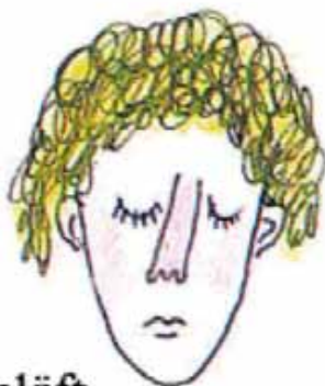
Jemand, der schläft.

fen, Mama!“ In therapeutischen Sitzungen mit der Mutter und dem Kind versuchte ich, ihm den Unterschied zwischen einem schlafenden und einem toten Menschen zu erklären: Ein schlafender Mensch ist warm, er atmet, sein Herz schlägt, er wacht wieder auf – ein toter Mensch ist ganz kalt, er atmet nicht mehr, sein Herz steht still, er kann sich nicht mehr bewegen und er wacht auch nicht mehr auf. Nach zwei Therapie-sitzungen verschwanden seine Ängste.